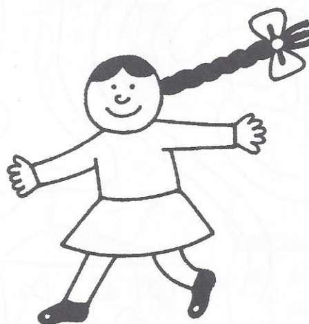
Sestřička je ze všech nejmenší .