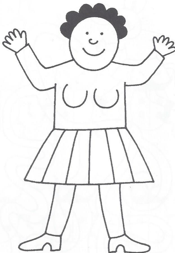
Máma je malá .