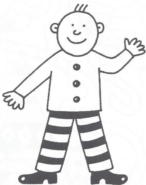
Já jsem menší než máma.